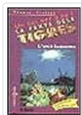
AVIO FANTASMA (V) TIGRES 3 BREZINA