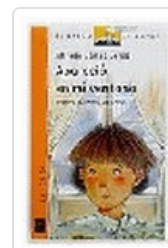
APARECIO EN MI VENTANA BVN 67 GOMEZ