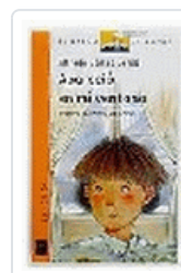
APARECIO EN MI VENTANA BVN 67 GOMEZ