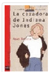
CAZADORA DE INDIANA JONES, LA BVR 53 BALZOLA