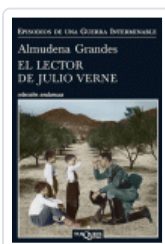
LECTOR DE JULIO VERNE, EL (ANDANZAS 730/2) GRANDES HERNANDEZ, ALMUDENA