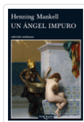
ANGEL IMPURO, UN (ANDANZAS 774) MANKELL, HENNING