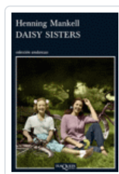
DAISY SISTERS (ANDANZAS 764) MANKELL, HENNING