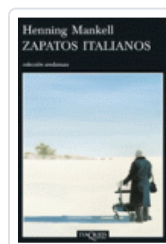
ZAPATOS ITALIANOS (ANDANZAS 643) MANKELL, HENNING