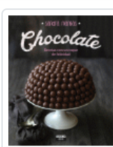
CHOCOLATE RECETAS CON UN TOQUE DE FELICIDAD MANGAS, SANDRA