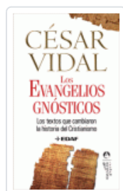
EVANGELIOS GNOSTICOS, LOS VIDAL, CESAR