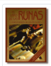
LIBRO DE LAS RUNAS [KIT] BLUM, RALPH