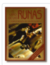
LIBRO DE LAS RUNAS [KIT] BLUM, RALPH