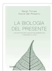
BIOLOGIA DEL PRESENTE, LA TORRES, SERGI / ROSARIO, DAVID DEL