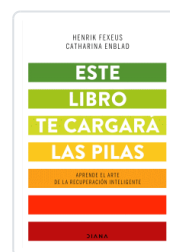
ESTE LIBRO TE CARGARA LAS PILAS FEXEUS, HENRIK / ENBLAD, CATHARINA