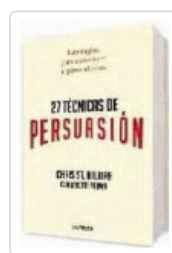
27 TÉCNICAS DE PERSUASION HILAIRE, CHRIS ST.