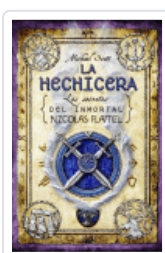
HECHICERA (SECRETOS INMORTAL NICOLAS FLAME I) SCOTT, MICHAEL