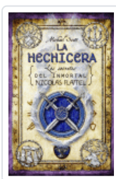
HECHICERA (SECRETOS INMORTALES NICOLAS FLAME VI) SCOTT, MICHAEL