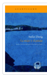
MUJER Y EL PAISAJE ZWEIG, STEFAN