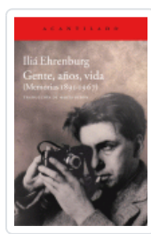
GENTE, AÑOS, VIDA EHRENBURG, ILIA