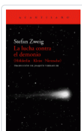
LUCHA CONTRA EL DEMONIO (HOLDERLIN - KLEIST - NIETZSCHE) ZWEIG, STEFAN