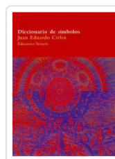
DICCIONARIO DE SIMBOLOS RUSTICA CIRLOT, JUAN EDUARDO