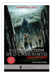
CORREDOR DEL LABERINTO, EL (1ª ED) DASHNER, JAMES