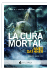
CORREDOR DEL LABERINTO 3, EL. LA CURA MORTAL DASHNER, JAMES