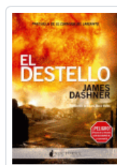
CORREDOR DEL LABERINTO 4, EL. EL DESTELLO DASHNER, JAMES