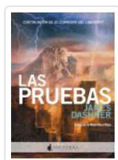
CORREDOR DEL LABERINTO 2, EL. LAS PRUEBAS DASHNER, JAMES