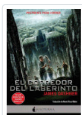
CORREDOR DEL LABERINTO, EL (1ª ED) DASHNER, JAMES