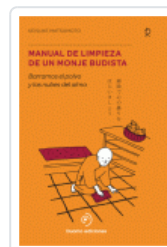
MANUAL DE LIMPIEZA DE UN MONJE BUDISTA MATSUMOTO, KEISUKE