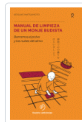
MANUAL DE LIMPIEZA DE UN MONJE BUDISTA MATSUMOTO, KEISUKE