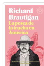
PESCA DE LA TRUCHA EN AMERICA, LA BRAUTIGAN, RICHARD