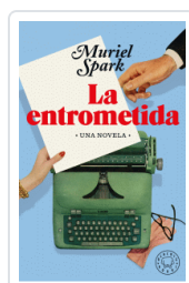
ENTROMETIDA, LA SPARK, MURIEL