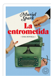
ENTROMETIDA, LA SPARK, MURIEL