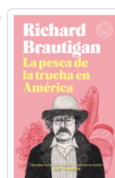
PESCA DE LA TRUCHA EN AMERICA, LA BRAUTIGAN, RICHARD