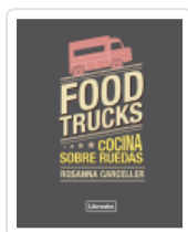
FOOD TRUCKS. COCINA SOBRE RUEDAS CARCELLER ESCUDER, ROSANNA