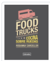
FOOD TRUCKS. COCINA SOBRE RUEDAS CARCELLER ESCUDER, ROSANNA