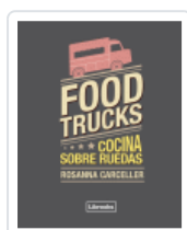
FOOD TRUCKS. COCINA SOBRE RUEDAS CARCELLER ESCUDER, ROSANNA