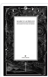
PENSAMIENTOS PARA MI MISMO MARCO AURELIO