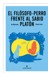
FILOSOFO-PERRO FRENTE AL SABIO PLATÓN MARCHAND, YAN