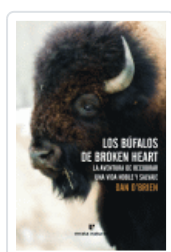
BUFALOS DE BROKEN HEART O'BRIEN, DAN