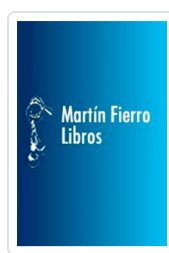
ATLAS DE LAS CONSTELACIONES HISLOP, SUSANNA