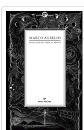
PENSAMIENTOS PARA MI MISMO MARCO AURELIO