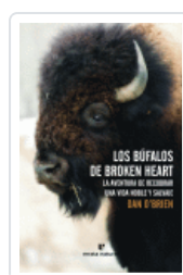
BUFALOS DE BROKEN HEART O'BRIEN, DAN