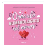
ORACULO NUMEROLOGICO DEL AMOR, EL PITY