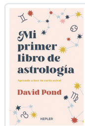
MI PRIMER LIBRO DE ASTROLOGIA POND, DAVID