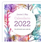
CALENDARIO LOUISE HAY 2022 HAY, LOUISE