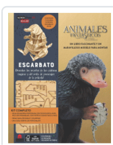
INCREDBUILDS ANIMALES FANTASTICOS ESCARBATO VV.AA.