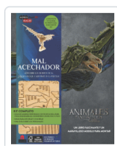
INCREDBUILDS ANIMALES FANTASTICOS MAL ACECHADOR VV.AA.