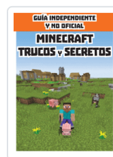
MINECRAFT TRUCOS Y SECRETOS VV.AA.