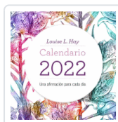
CALENDARIO LOUISE HAY 2022 HAY, LOUISE