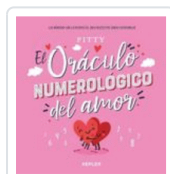
ORACULO NUMEROLOGICO DEL AMOR, EL PITY PITY