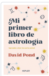
MI PRIMER LIBRO DE ASTROLOGIA POND, DAVID