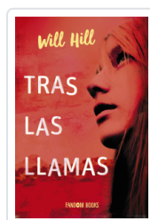
TRAS LAS LLAMAS WILL HILL