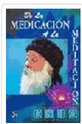
DE LA MEDICACION A LA MEDITACION OSHO