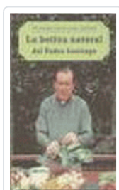
BOTICA NATURAL DEL PADRE SANTIAGO, LA