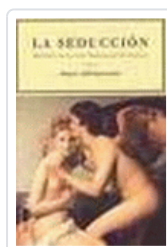
SEDUCCION, LA ADRIANSES, JUAN