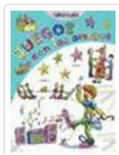
JUEGO CON LOS AMIGOS (DIVERTILANDIA)