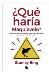
QUE HARIA MAQUIAVELO? BING, STANLEY