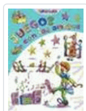
JUEGO CON LOS AMIGOS (DIVERTILANDIA)