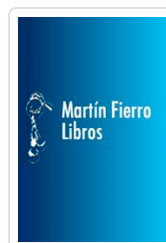
OFICIOS CON GULLIVER, LOS (APRENDO)