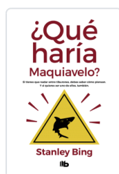
QUE HARIA MAQUIAVELO? BING, STANLEY