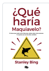
QUE HARIA MAQUIAVELO? BING, STANLEY