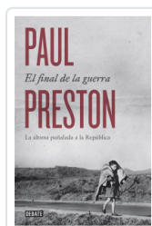
FINAL DE LA GUERRA, EL PRESTON, PAUL