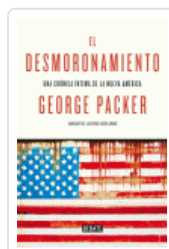
DESMORONAMIENTO, EL PACKER, GEORGE