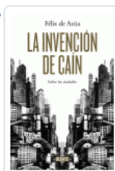
INVENCIÓN DE CAIN, LA AZUA, FELIX DE