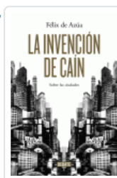
INVENCION DE CAIN, LA AZUA, FELIX DE