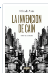
INVENCIÓN DE CAÍN, LA AZÚA, FELIX DE