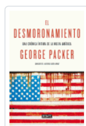
DESMORONAMIENTO, EL PACKER, GEORGE