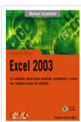
EXCEL 2003 MANUAL AVANZADO CHARTE, FRANCISCO