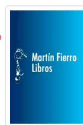
EXCEL 2003 MANUAL IMPRESINDIBLE