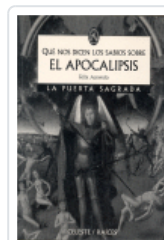
QUE NOS DICEN LOS SABIOS SOBRE EL APOCALIPSIS Acevedo Pérez, Félix