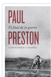
FINAL DE LA GUERRA, EL PRESTON, PAUL