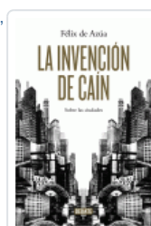
INVENCIÓN DE CAIN, LA AZUA, FELIX DE