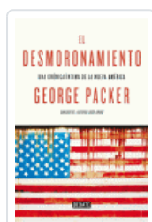
DESMORONAMIENTO, EL PACKER, GEORGE