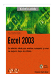
EXCEL 2003 MANUAL AVANZADO CHARTE, FRANCISCO