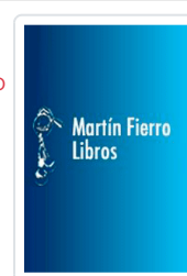
EXCEL 2003 MANUAL IMPRESINDIBLE