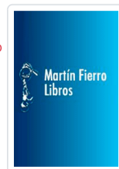
EXCEL 2003 MANUAL IMPRESINDIBLE