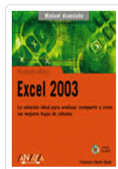
EXCEL 2003 MANUAL AVANZADO CHARTE, FRANCISCO