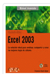
EXCEL 2003 MANUAL AVANZADO CHARTE, FRANCISCO