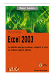
EXCEL 2003 MANUAL AVANZADO CHARTE, FRANCISCO