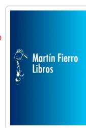
EXCEL 2003 MANUAL IMPRESINDIBLE