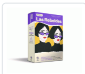
CAJA DE LAS REBELDES, LA CRUZ VENTOSA, AIXA DE LA / CAPDEVILA-ARG