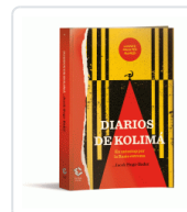
DIARIOS DE KOLIMA HUGO-BADER, JACEK