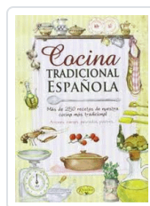
COCINA TRADICIONAL ESPAÑOLA. MAS DE 250 RECETAS TODOLIBRO, EQUIPO