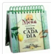
MENU PARA CADA DIA, UN. 365 RECETAS CASERAS AA VV