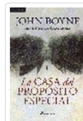
CASA DEL PROPOSITO ESPECIAL BOYNE