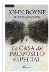
CASA DEL PROPOSITO ESPECIAL BOYNE