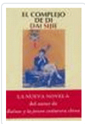
COMPLEJO DE DI SIJIE, DAI